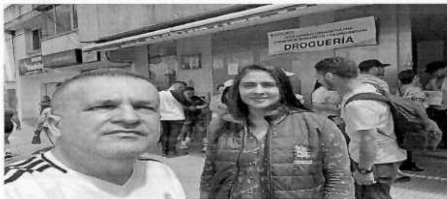
DESCENTRALIZADO EL JAPON 22 DE AGOSTO