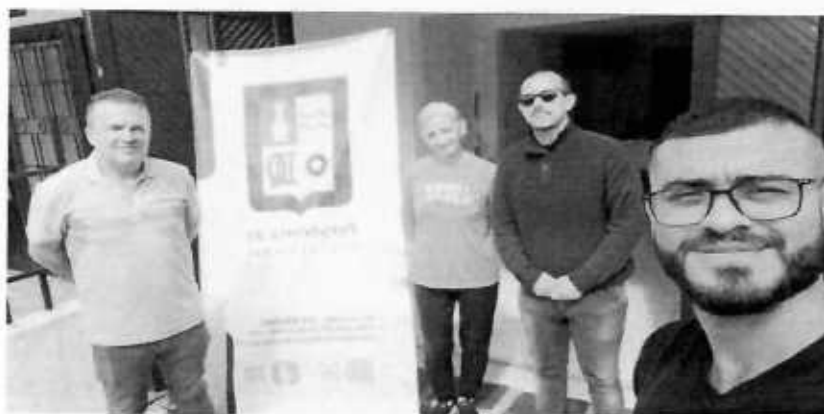
PREPARATORIA CABALGATA 15 DE AGOSTO