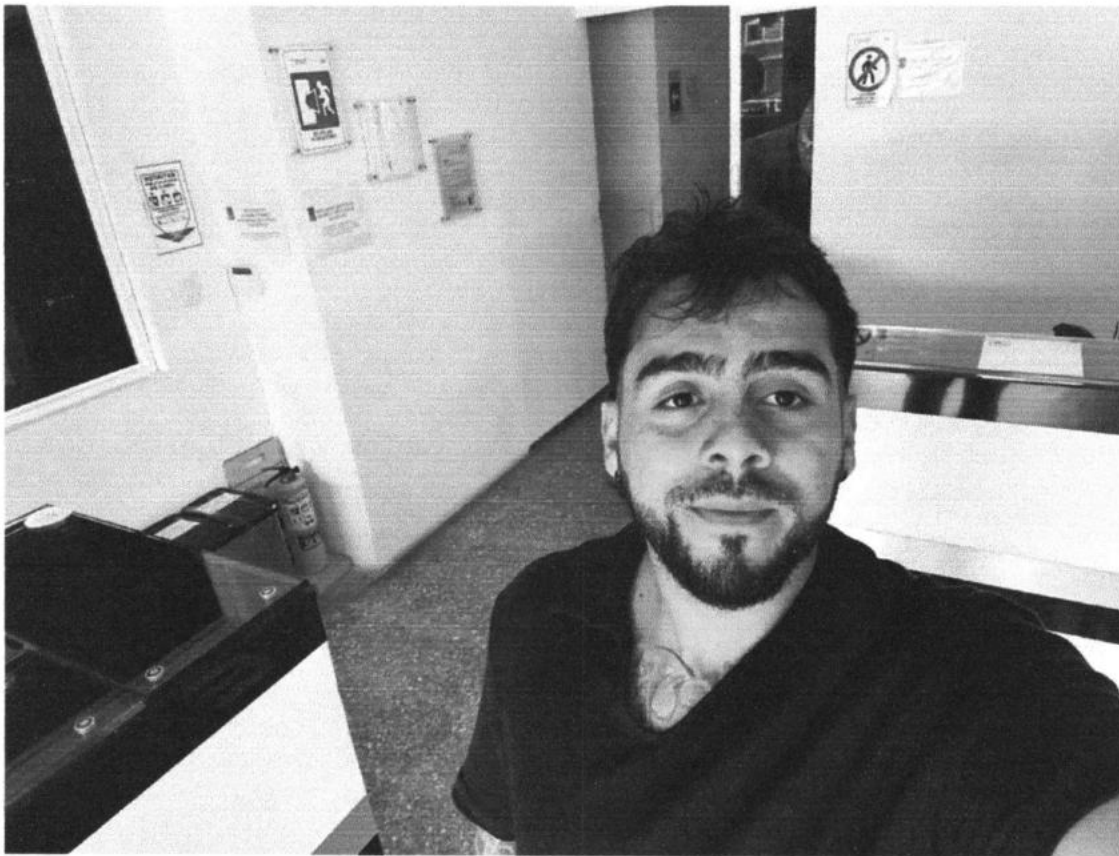
D) Visitas y atención de solicitudes de los líderes comunitarios frente a las problemáticas que se presentan en el municipio de Dosquebradas.